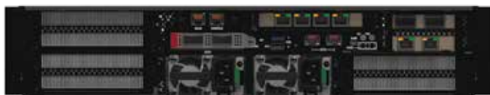
Сервер Kraftway TS3020 (задняя панель)