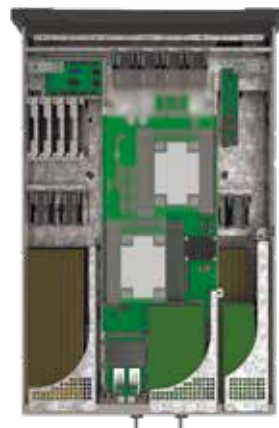
Внутреннее устройство сервера

Сервер Kraftway TS3020 предназначен для эффективной обработки параллельных потоков данных и ресурсоемких графических вычислений. Модель обеспечивает высокую производительность и стабильную работу при длительных нагрузках. Сервер выполнен в форм-факторе 2U и предназначен для установки в стандартные 19-дюймовые телекоммуникационные стойки. Поддерживает установку двух процессоров Intel® Xeon® Scalable 3-го поколения в исполнении LGA4189 (сокет P4). Поддерживается установка от одного до трёх полноразмерных графических ускорите-