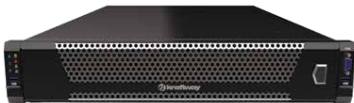
Сервер Kraftway TS3020 (передняя панель)

Компания Kraftway представляет новую разработку - современный мощный сервер Kraftway TS3020, предназначенный для решения ресурсоемких задач автоматизированного проектирования, искусственного интеллекта, криптографии, обработки больших массивов данных и высокопроизводительных вычислений