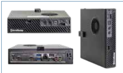
ПЭВМ Крафтвэй IT223