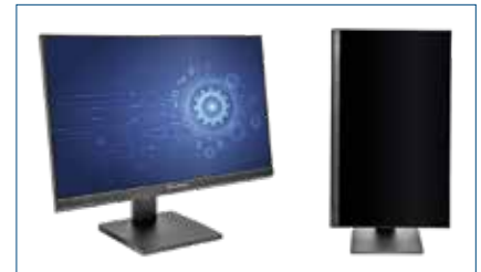
ПЭВМ Крафтвэй IT232