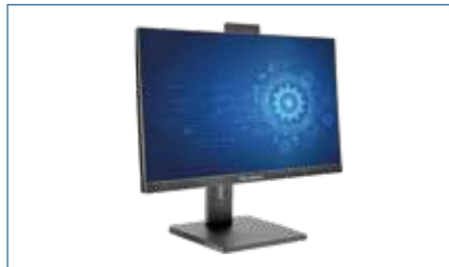
ПЭВМ Крафтвэй IT231