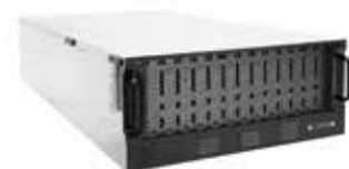
Дисковая корзина на 78 дисков