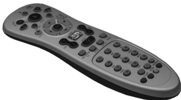
Пульт дистанционного управления

Персональный компьютер Kraftway Urban KU23 комплектуется пультом дистанционного управления, позволяющим управлять мультимедийным программным обеспечением на удалении до 7,5 метров от компьютера. На передней панели компьютера расположен ИК-датчик, для уверенной связи направляйте пульт в его сторону.